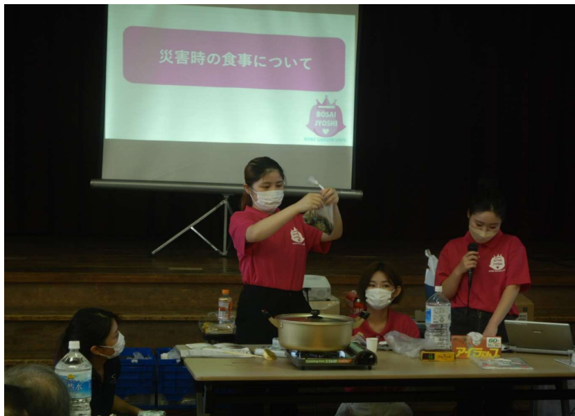
防災女子による防災食講演