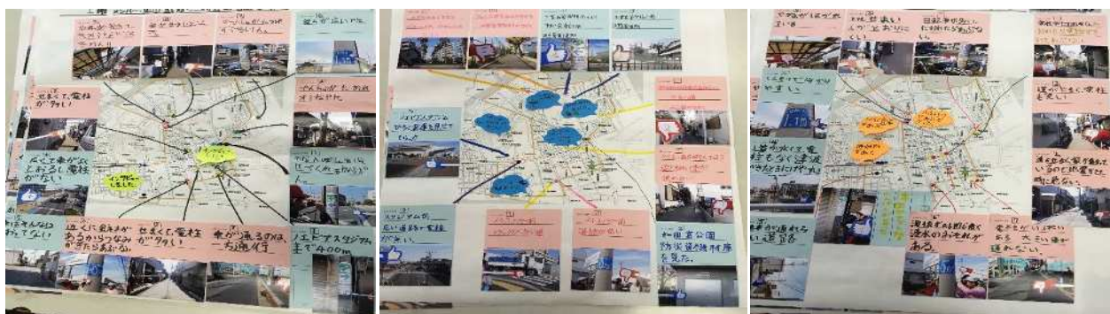
児童がつくった安全マップ