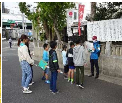
まち探検中の防災クイズ