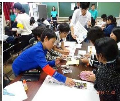
マップ作りの様子