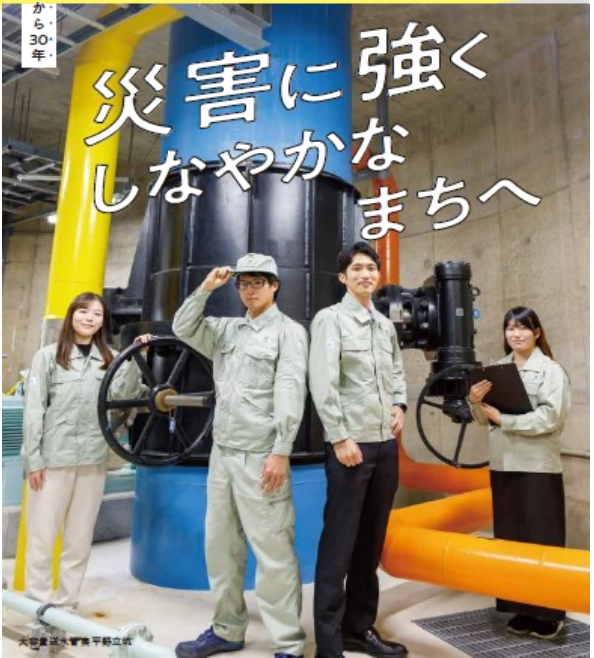
大谷量送水管集平貯立機

くやくしよ てつづ こそだ しえんきん 区役所の手続き、子育ての支援金など、 わからないことがあれば、