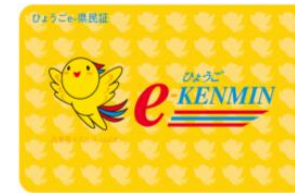
ひょうごe-県民制度