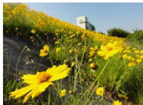
ブラックリスト掲載種 オオキンケイギク