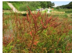
レッドリスト掲載種（Cランク） タコノアシ