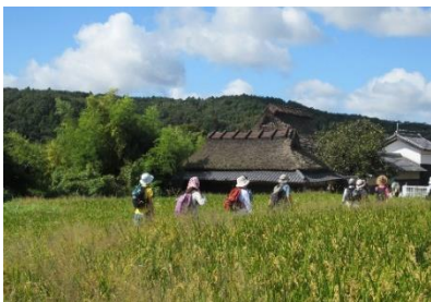
・かやぶき古民家と稲穂

暑さも少し和らぎ、ヒガンバナや道端のくり、収穫がすすむ田んぼなど、秋らしさ満点の楽しいハイキングとなりました。