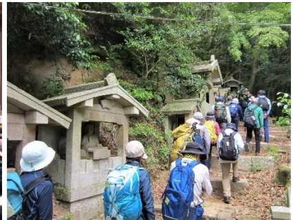
・奥之院に続くミニ八十八箇所巡り