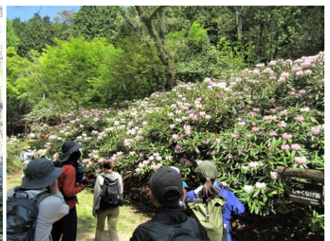
・植物園ではシャクナゲが満開でした