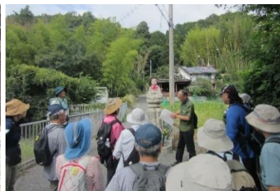
・学芸員による丹生山の丁石の解説