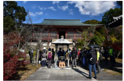
・住職から太山寺本殿の解説を聴きます