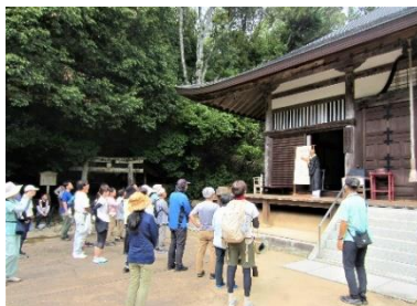
・無動寺での住職による仏像説明