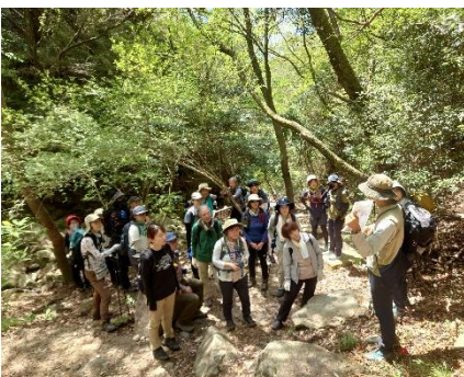
・柚谷道でのガイドによる解説風景

阪急六甲駅近くの護国神社を出発し、柚谷道の急な山道を登って穂高湖へ。ツツジが見頃な湖畔でお昼休憩し、徳川道を歩いて最後は森林植物園に到着しました。道中ではガイドによる徳川道や六甲山の開発に関する歴史の話、最後は植物園の副園長による植物解説がありました。好天にも恵まれたことともあり、充実したハイキングになりました。