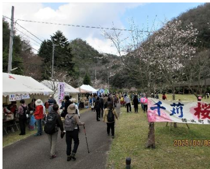
・にぎわう道場千苺さくら祭りの会場