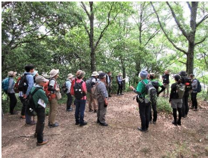
・学芸員による山城解説