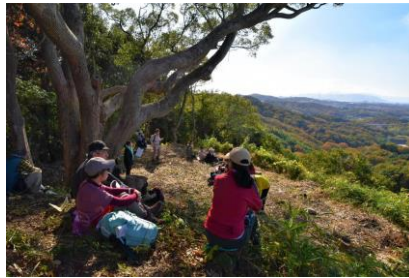
・高畑城跡から明石海峡大橋や家島が見えました