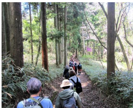
・杉や檜の並木が点在する徳川道を抜けます