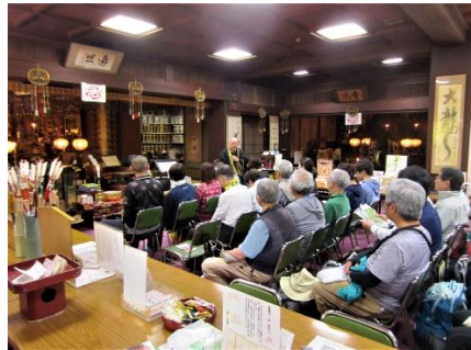
・大龍寺で住職の法話を聴聞