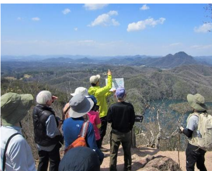
・大岩岳山頂でのガイドによる解説風景

JRの道場駅から出発し、さくら祭りの会場で昼食をして、振舞われたおもちをいただきました。そして午後からは大岩岳(おおいわがたけ)に向けて登山開始しました。全員完走とはなりませんでした。ガイドによる植物や地質、地域の歴史や千苺ダムへの解説も要所であり、春の陽気の中、楽しいハイキングとなりました。