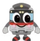
るっくん 【山陽電車】