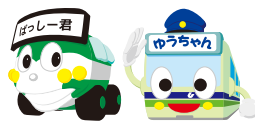
ぼっしー君 ゆうちゃん 【神戸市交通局】