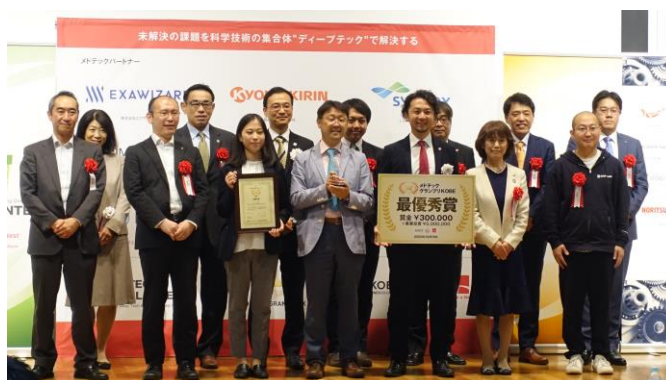
第3回メドテックグランプリKOBÉの様子（2020年10月10日実施）

グランプリ後は、各チームの事業化プランの実現に向けて、神戸医療産業都市推進機構のコーディネーターとリバナスのサイエンスブリッジコミュニケーターが連携し、様々な面からエントリーチームをサポートしています。