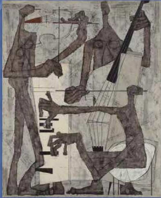
中島節子 《トリオ》 1956年 当館蔵