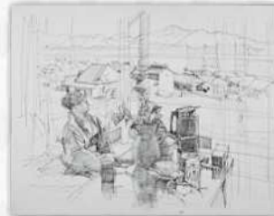
小磯良平 左：《小豆島の風景》1962年 当館蔵 右：《室内のパレリーナ》1967年 当館蔵