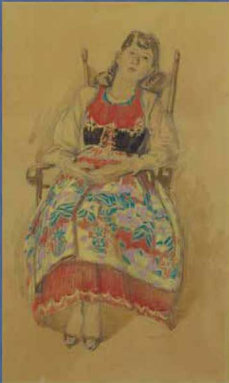
小磯良平 《少女像》 制作年不詳 当館蔵