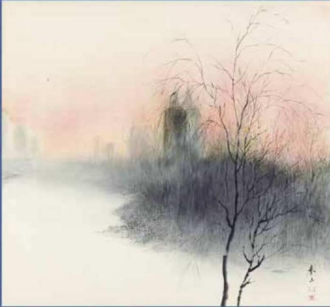
松本奉山 《ニューヨークの夕暮》 1969年 大本山 摩耶山天上寺蔵