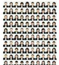
澤田知子 《Recruit/Black》 2006年 100 Chromogenic prints タグチアートコレクション/ タグチ現代芸術基金 ©Tomoko Sawada

■展示作家 巖谷/相笠昌義/会田誠/朝倉摂/猪熊弦一郎/内田巖/梅宮馨四郎/海老原喜之助/大森啓助/尾田龍/桂川寛/北川民次/小磯良平/乙うたろう(前光太郎)/澤田知子/新海覚雄/菅原光人/須田寿/高山良策/田中忠雄/長尾和/中谷泰/中村宏/西村功/野見山晴浩/真鍋博/宮本三郎/やなぎみわ/脇田和(五十音順)