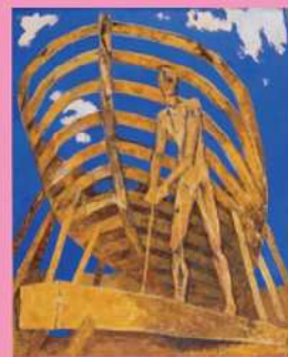
海老原喜之助《船を造る人》1954年 油彩・キャンバス 北九州市立美術館

■主催：神戸市立小磯記念美術館、神戸新聞社 ■協賛：一般財団法人みなと銀行文化振興財団 ■後援：神戸新交通株式会社、NHK 神戸放送局、サンテレビジョン、ラジオ関西 開館時間▶午前10時～午後5時(入館は午後4時30分まで) / 休館日▶毎週月曜日、10月10日(火) [ただし10月9日(月)は開館] / 入館料▶一般：1000(800)円 ・大学生 500(250)円 ※(*)内は20名以上の団体料金・高校生以下無料(学生証、生徒手帳などをご提示ください)・神戸市在住の65歳以上の方：500円(住所と年齢が証明できるもの をご提示ください)障がい者手帳、またはスマートフォンアプリ「ミライロID」ご提示で無料・「神戸ゆかりの美術館」「神戸ファッション美術館」へは、当日入館券(半券)のご提示により、 割引料金で入館できます。