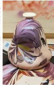
乙うたろう/前光太郎 《つぼみ》 2022年 陶器 作家蔵