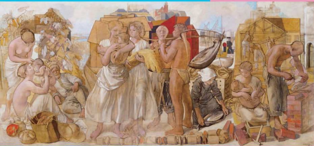
小磯良平《働く人びと》1953年 油彩・キャンバス 神戸市立小磯記念美術館寄託