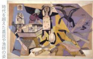
猪熊弦一郎 《からす》 1953年 油彩・キャンバス 丸島市猪熊弦一郎現代美術館