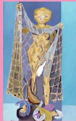
鰻田相〈魚網〉1952年 油彩・キャンバス 福岡市美術館