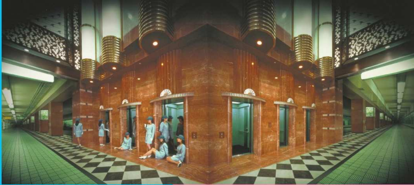
やなぎみわ《案内嬢の部屋B1》1997年 ダイレクトプリント 大阪中之島美術館