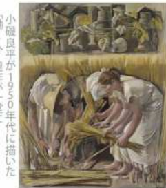
小磯良平 《麦刈り》 1954年 油彩・キャンバス 姫路市立美術館