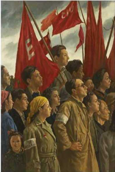
内田巖 《歌声よこせこれ(文化を守る人々)》 1948年 油彩・キャンバス 東京国立近代美術館