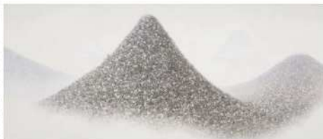
会田誠 《灰色の山》 2009-2011年 アクリル・キャンバス タグチアートコレクション/タグチ現代芸術基金