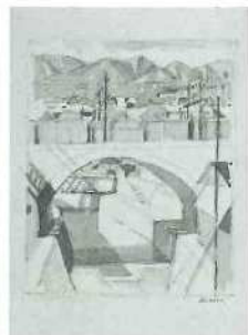
小磯良平《御影風景》1962年 水彩、コンテ・紙