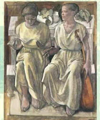
小磯良平 《音楽》 1954年