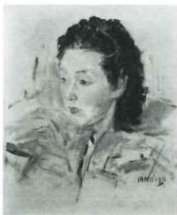
小磯良平《婦人像(ポートレート)》1948年 油彩・キャンバス