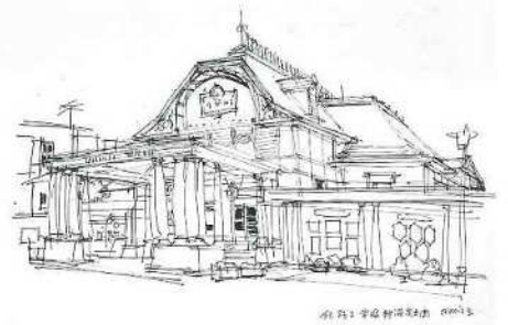
小磯良平《宝塚新温泉玄関(新人国記)》1966年 インク・紙