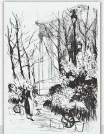
林 重義 《花売り (B)》 1933-34年 リトグラフ 当館蔵