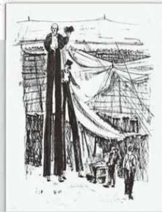
林 重義 《足長おじさん》 1933-34年 リトグラフ 当館蔵