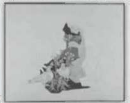
小磯良平《鳩と婦人》 1959年 プレスコ 当館蔵