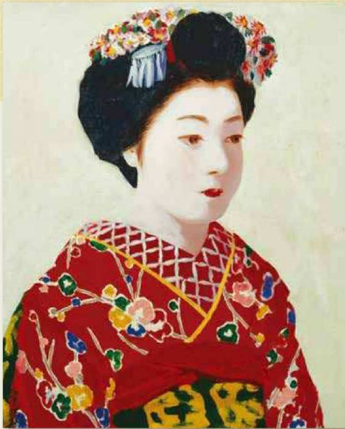
林 重義 《舞妓(赤)》 1934(昭和9)年 油彩 当館蔵