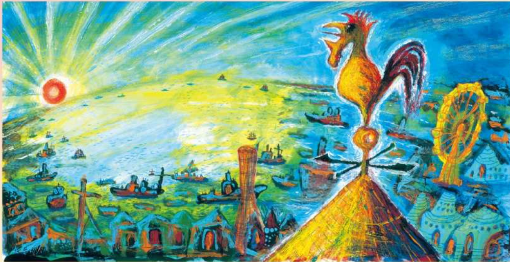
スズキコージ「コーベッコ」(2017年12月1日発行) 原画 作家蔵 © 2017 Koji Suzuki