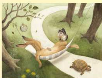
いまい あやの「イソップ物語 13のおはなし」 (2012年7月10日発行) 原画 作家蔵 © 2012 Ayano Imai