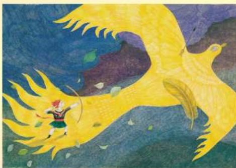
さかた きよこ「金の鳥」(文・八百板洋子、2018年12月20日発行) 原画 作家蔵 © 2018 Kiyoko Sakata