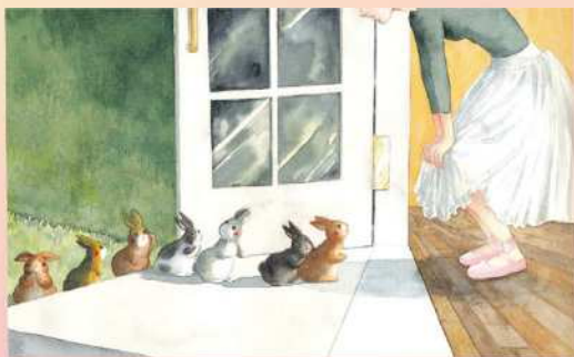
豊福 まさこ「おどろたいの」(2018年9月1日発行) 原画 作家蔵 © 2018 Makiko Toyofuku