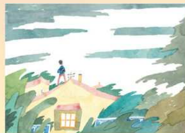
植田 真「チョコレートのおみやげ」 (文・橋田 淳、2021年6月1日発行) 原画 作家蔵 © 2021 Makoto Ueda