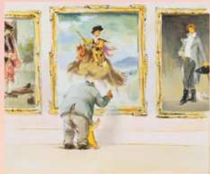
ガブリエル・バンサン「くまのアーネストおじさん、まいごになったセレスティーン」 (1985年11月10日発行) 原画 BL出版 蔵 Ernest et Célestine au musée © 1985 Gabriella Vincent