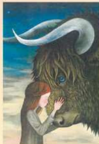
さとう ゆうすけ「ノロウェイの黒牛」 (文・なかがわ ちひろ、2019年3月10日発行) 原画 作家蔵 © 2019 lussuque Satoh