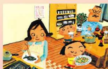
長谷川 義史「おへそのあな」 (2006年9月20日発行) 原画 作家蔵 © 2006 Yoshifumi Hasegawa