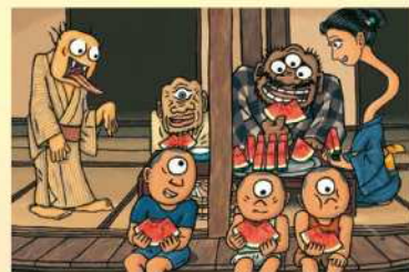
川端 誠「お化けの真夏日」 (2001年8月10日発行) 原画 作家蔵 © 2001 Makoto Kawabata