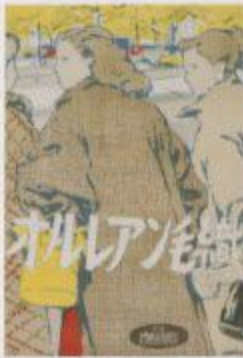
神戸市立美術館 1937年神戸市立美術館開館30周年記念企画展「朝鮮半島」