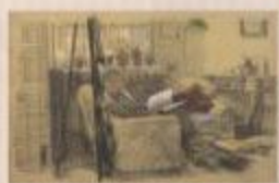
小磯良平(室内の静物)1950年 高松展