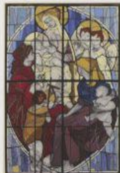
神戸市立美術館 1937年神戸市立美術館開館30周年記念企画展「神戸市立美術館」