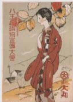
神戸市立美術館 1937年神戸市立美術館開館30周年記念企画展「Yamanote」