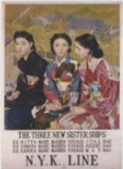
神戸市立美術館 1937年神戸市立美術館開館30周年記念企画展「THE THREE NEW SISTER SHIPS」