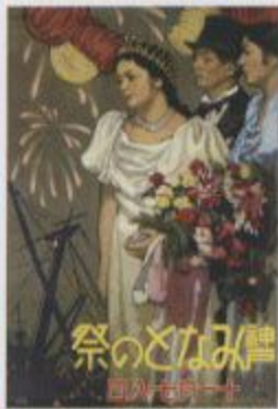
神戸市立美術館 1927年神戸市立美術館開館10周年記念企画展「祭りのとき」