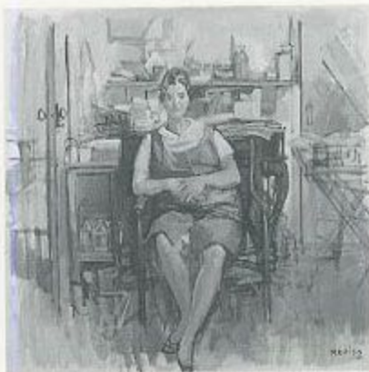
小磯良平「アトリエにて」1962年 油彩・キャンバス 79.7×79.7cm