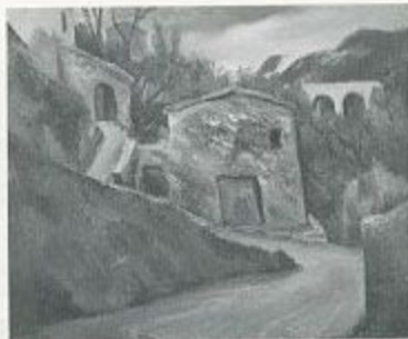
小磯良平「水車小屋のある風景」1929年 油彩・キャンバス 60.7×74.8cm