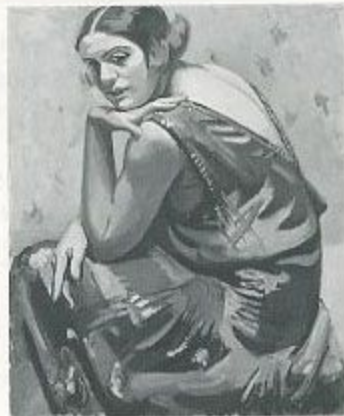
小磯良平「青衣の女」1929年 油彩・キャンバス 73.0×60.0cm