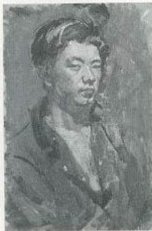
小磯良平「自画像」1926年 油彩・キャンバス 80.2×52.5cm