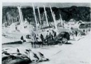
高村孝之介 海舟風景 1949頃 油彩・キャンバス 52.9×73.2cm