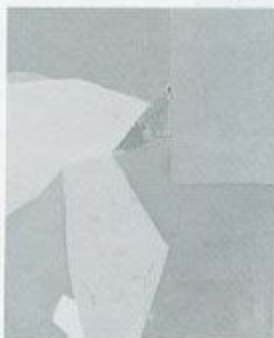
岡田謙三 雪 1954 油彩・キャンバス 110.0×96.0cm