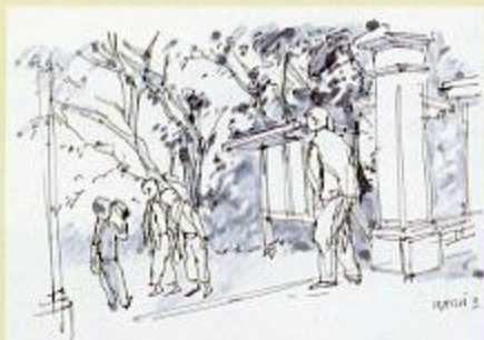
「人間の壁」第304回 1958年 木版刷