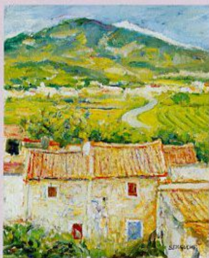
風景画「プロヴァンス・モンテントゥー」1930年 油彩