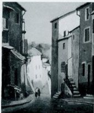
三木健太郎 カーニバル風景 1927.91頃 油彩・キャンバス 72.0×90.0cm