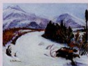
風景画「高野山」1932年 油彩