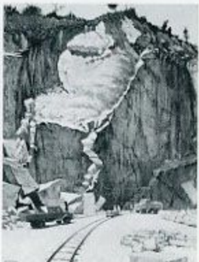
村野一夫 石切崖(II) 1956 油彩・キャンバス 130.0×97.0cm