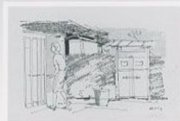
第292回 1957 インク、鉛筆/セール・紙

小磯良平が手がけた、新聞連載小説『適齢期』(白川渥・著)の挿絵原画を紹介するシリーズ、第6張です。第260回から第300回(最終回)までの挿絵原画および章カットと小説の抜粋を紹介します。