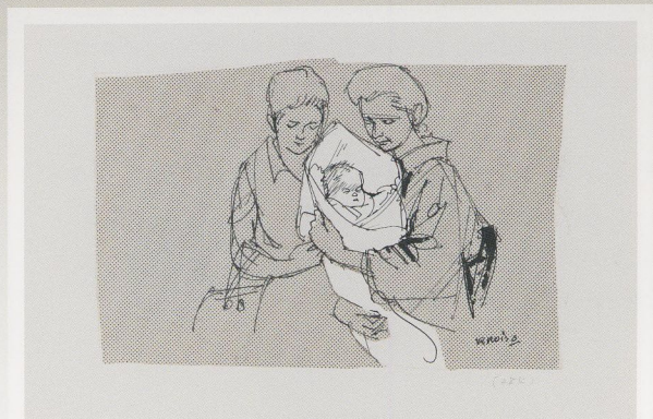
小磯良平《新聞連載小説挿絵原画『適齢期』第284回》1967 インク、スクリーン・紙