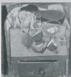
《かばらやのあひな動物》 1957 原画/キャンパス