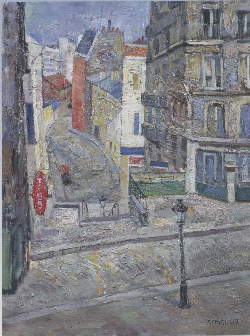
関口俊吾《パリ、モンマルトル》1981 油彩・キャンバス

●会期等は今後の諸事情により 変更する場合があります。 最新の情報は美術館公式HPで ご確認ください。