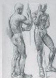
《裸も持ッ男》 1955 サンゾーニ・紙