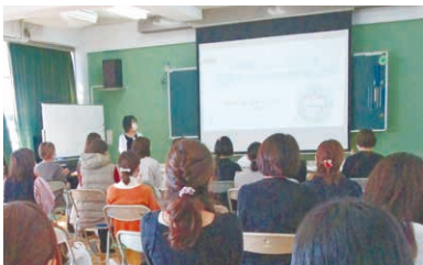
「わが子に話したくなる保護者のための性教育入門」と題して講演。

末娘を妊娠中、8歳の長男に「赤ちゃんはどうやってお母さんのおなかに来たの?」と聞かれたのがきっかけです。改めて性教育について調べるうち、人権の尊重を基本とする包括的性教育の