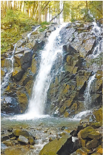
売電収益は地区に人を呼ぶための整備費に。

宍粟市千種町の黒土地区では有志が中心となり、黒土川の水を活用する小水力発電所を運営しています。約10年前、大正期に水力発電が行われていたと知り、地区の活性化のために再び取り組みと合同会社を設立。発電所建設に向け、資金集めや住民への説明に奔走しました。県の「地域創生再エネ発掘プロジェクト」の補助金や(公財)ひょうご環境創造協会の無利子貸付制度を利用し、2023(令和5)年5月、ついに黒土川小水力発電所が稼働しました。売電収益は現在、一部を自治会に寄付し、残りは上流にある