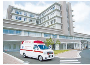
県立加古川医療センター

● 地域の救急医療を担う県立加古川医療センターなどの医療機関へのアクセスが良くなり、救急医療体制が強化される。