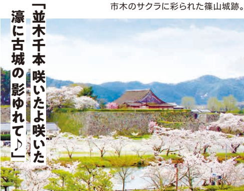
「並木千本咲いたよ咲いた 濠に古城の影ゆれて」