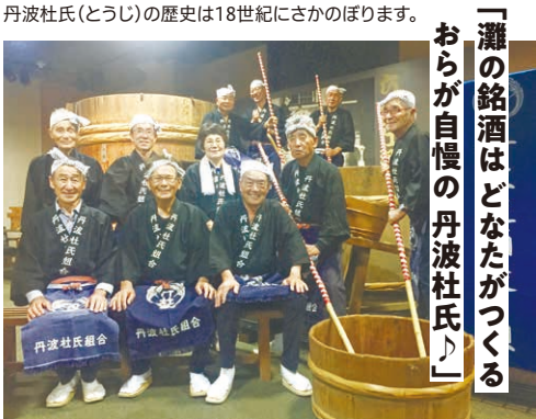
丹波杜氏(とうじ)の歴史は18世紀にさかのぼります。