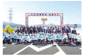
小野ランプ付近で行われた開通式