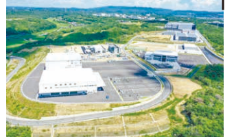
ひょうご小野産業団地