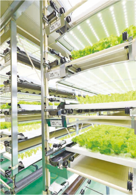
成長したレタスは自動で搬出されます。

異常気象や自然災害が農作物の安定生産に大きな影響を及ぼす中、注目を集めているのが植物工場です。LED光の強度や波長、温湿度、養分等を高度に制御することで計画的な栽培を実現し、省人・省力化により人手不足を補い、作業負担を大幅に軽減。県内でも、次代の農業に取り組む事業者が増えています。(取材・文 本紙編集部)