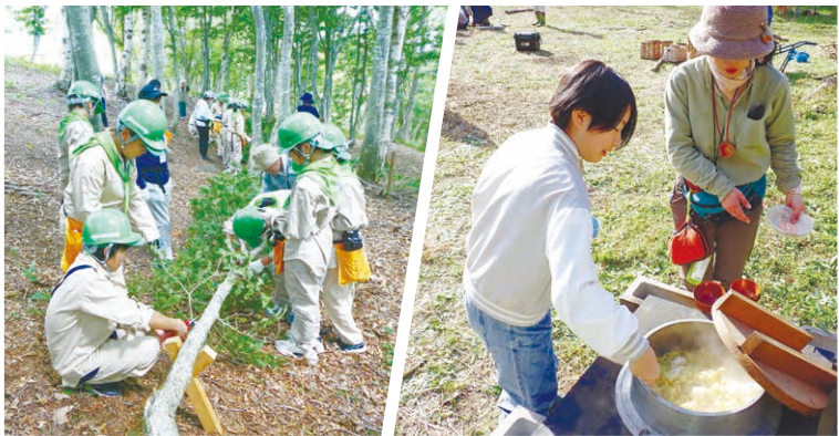
あさご緑の少年団(朝来市)の奉仕活動。 やまもりっこクラブ(宝塚市)のレクリエーション活動。

緑の少年団は、森や緑を守り育てることを目的とした、子どもたちが主体の団体です。活動は大きく分けると、森の機能や保全について学ぶ学習活動、植樹や樹木の手入れを行う奉仕活動、ハイキングやキャンプなどを楽しむレクリエーション活動の3つ。2025(令和7)年10月現在、県内で120団、7,567人の団員が、自然の中で学び、遊びながら森と豊かな心を育んでいます。緑を守る一員になりませんか。(県治山課)