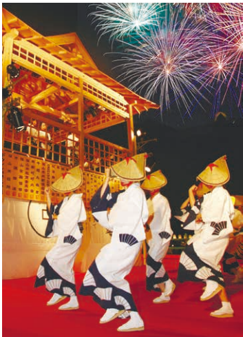
デカンショ節を歌い踊るデカンショ祭は毎年8月に開催。

丹波篠山の地では、時代ごとの風土や名所、名産品などをデカンショ節の歌詞にして愛唱することで、故郷の風景を守り伝えてきました。その流れは脈々と受け継がれており、毎年「日本デカンショ節大賞」として新しい歌詞を公募。優秀作品は、その年のデカンショ祭で披露されます。今では400番を超えるデカンショ節。そのストーリーは2015(平成27)年、他県の17件と共に日本遺産の第1号に認定されました。(丹波篠山市市長公室 隅田浩規さん)