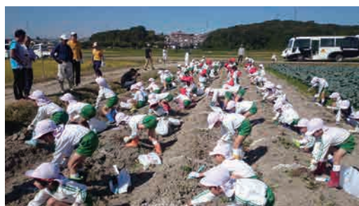
農業体験（サツマイモ）