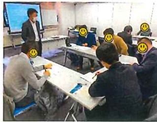
●さまざまなテーマのグループワークで楽しく学んで頂きました。

★知識の整理が出来て、業務の可視化が出来るようになりました。次年度も開催を希望します。