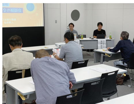
ICT活用みんなの相談会の様子

4月からコミセンにICT活用専門相談員がメンバーに加わり、ホームページの作成やSNS活用のご相談をいただいています。そんな中、「ICT活用みんなの相談会」を市内2か所で開催し、ICT活用の情報提供や活用事例の紹介、そして個別相談会をおこないました。参加者からは「ICT活用のメリットがわかった」「役立つ無料ツールの紹介が参考になった」との声がありました。