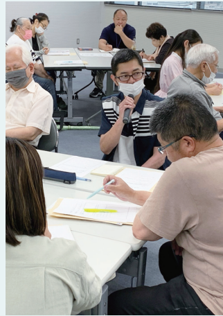
自治会役員初任者研修の様子

当日は手探りで活動を始めた新任役員と経験ある役員が混在して活発な情報交換が行われました。また、働き世代を巻き込む活動や子ども向けイベントの参加者を増やす方法などの