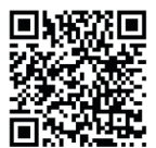
Como descartar lixo de grande porte