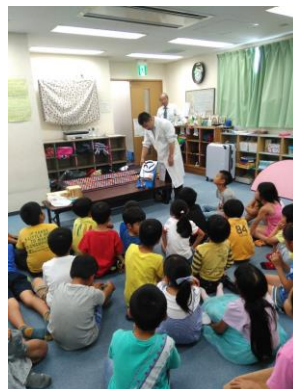
出前エコ教室の様子（2019 年度）

神戸製鋼は、鉄と電気をテーマにし、サイエンスショーやクイズ大会、エコカルタなどを通じて、環境や電気の大切さ、鉄の便利さを学ぶプログラムを提供しています。