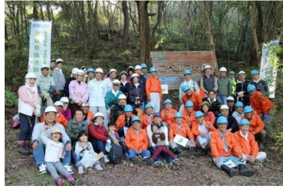
森林整備活動後の集合写真（2019 年度）