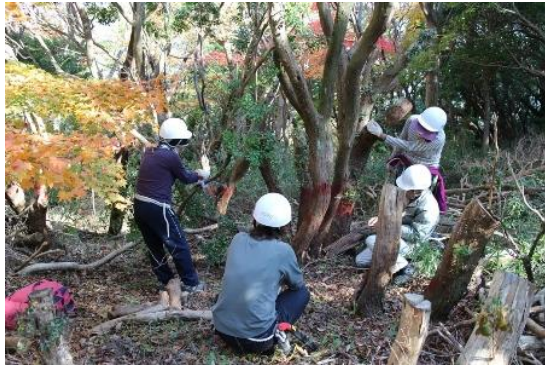
森林整備活動中の様子（2019 年度）

これまで森林エリアの除間伐、下草刈り等の作業を続けてきた結果、太陽光が森の中に差し込み始め、元気な森を取り戻しつつあります。