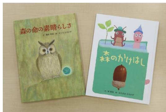
第 8 回金賞作品絵本

例年、表彰式を開催しておりますが 2020 年度は、新型コロナウイルス感染症の拡大防止のため、オンラインで実施しました。