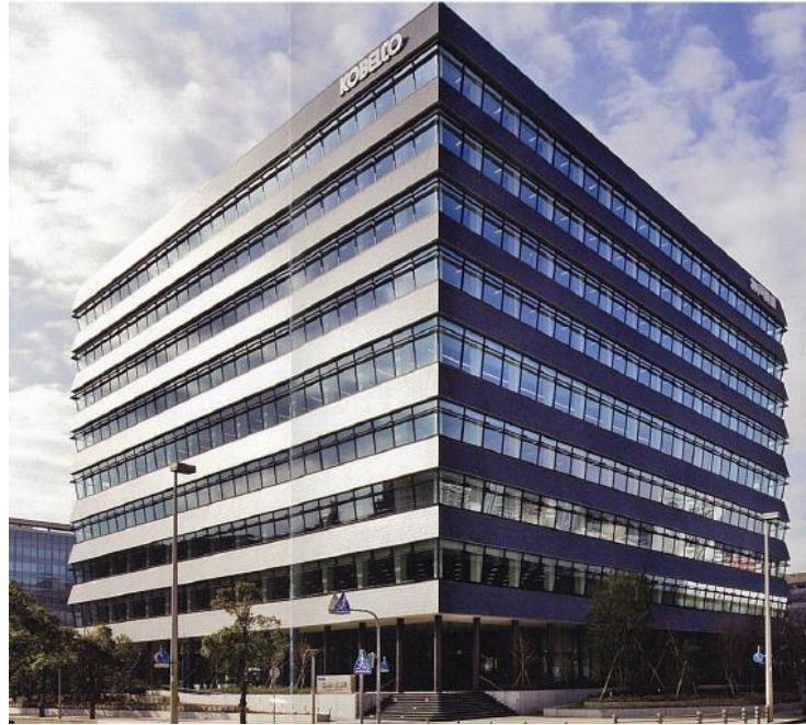
神戸本社ビル外観