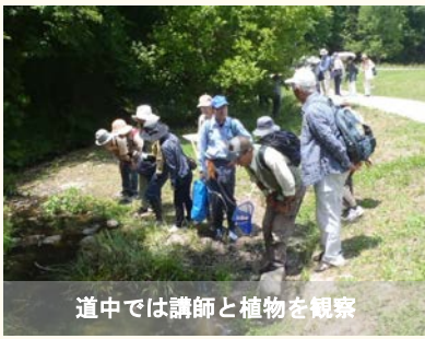
道中では講師と植物を観察