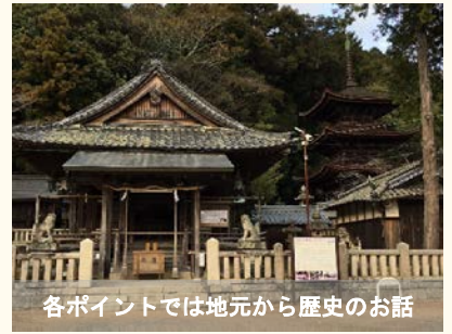
各ポイントでは地元から歴史のお話