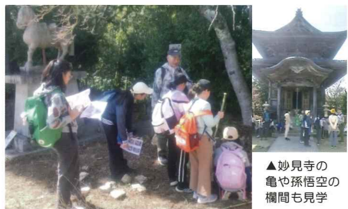
▲妙見寺の亀や孫悟空の欄間も見学

▼講師の説明を熱心に聴きながら、事前に配布した写真と同じ山野草をゲーム感覚で探すキッズたち。講師から、ただ見るだけではなく、自然を観察することの大切さを学ぶ。