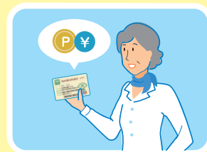
貯まったポイントは現金に交換