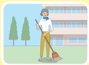
高齢者施設等での掃除、洗濯物の整理などの活動

神戸市内にお住まいの65歳以上の方が、高齢者施設等で下記の対象となる活動を行なった場合に、ポイントを貯めることができ、貯まったポイントは現金と交換できる制度です。