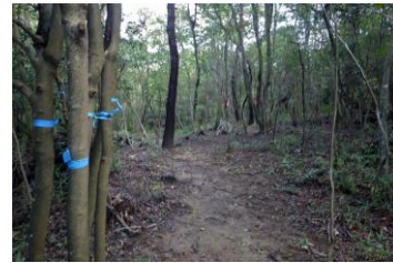
伐採する個体は青、残す個体はピンクでそれぞれマーキング

散策路沿いで伐採する樹と残す樹を選び、テープでマーキングしました。観察の支障になる個体や森を暗くしている木を中心に伐採します。簡易的な樹名札をとり付けました。