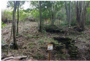
見通しが良くなりました