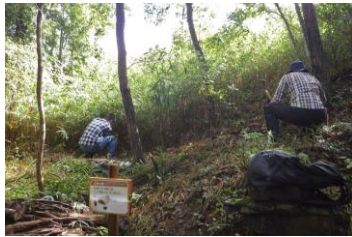
地道に刈り取りました