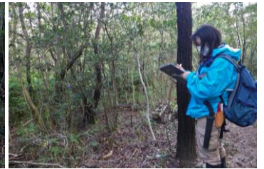
散策路沿いの計画を思案中