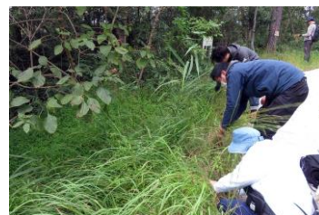
メリケンカルカヤの抜き取り