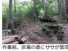
作業前。炭窯の奥にササが繁茂

交流棟の炭窯周りに生い茂ったササを刈りました。ササの中で、けもの道を発見。どんな動物が利用しているのでしょうか。