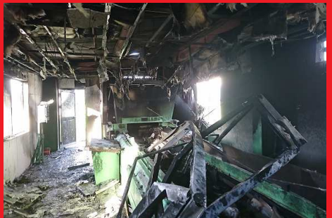
リサイクル工場の建屋・設備が焼けてしまった事例