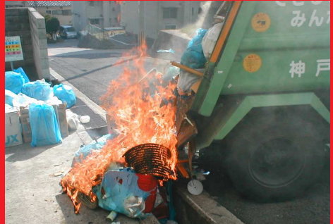
リサイクル工場の建屋・設備が焼けてしまった事例