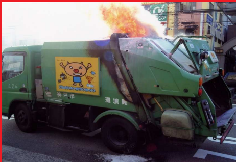
誤った排出ごみが原因で神戸市環境局パッカー車が燃えてしまった事例