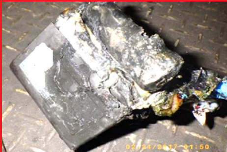
発火原因となったリチウムイオン電池