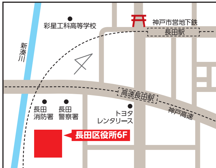
長田区役所6階 【長田区北町3-4-3】