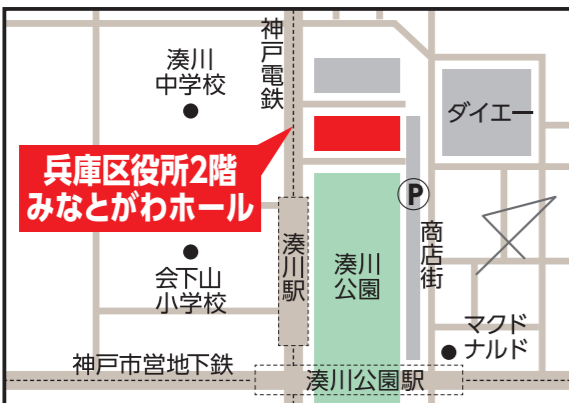
兵庫区役所2階みなとがわホール 【兵庫区荒田町1-2-1】