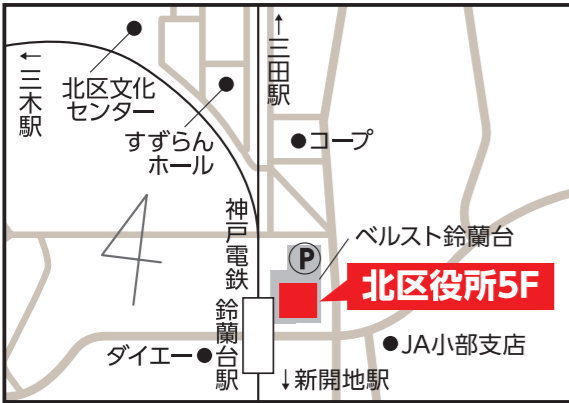
北区役所5階 【北区鈴蘭台北町1-9-1】