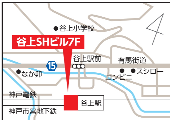
谷上SHビル7階 【北区谷上東町1-1】