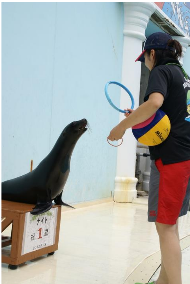
来園当初のナイト