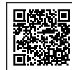
違反対象物公表制度