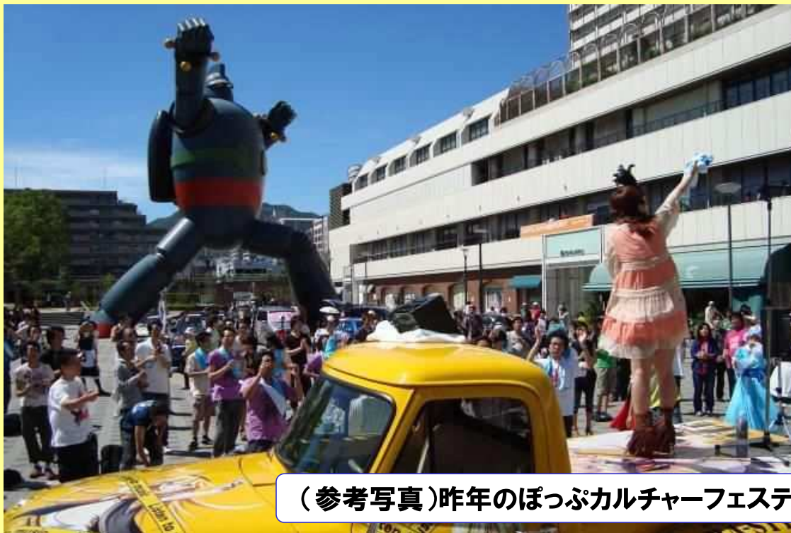
(参考写真) 今年のぽっぷカルチャーフェスティバルの様子

「神戸ローストショコラ」発売にあわせ、 神戸ぽっぷカルチャーフェスティバル(9月21～23日) にブース出展