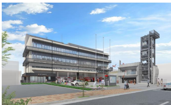
灘消防署 完成予想図

灘区の防災拠点である灘消防署の機能強化を図るため、現地での建て替え工事を進める。