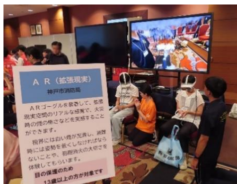
ARを活用した災害疑似体験

市民の防災意識の向上を図るため、火災・土砂災害VR、消火訓練AR及びVR起震車を活用した防災教育を実施する。また、若い世代を対象とした市民救命士講習を推進し、応急手当の普及を図る。