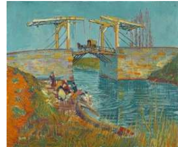
《アルルの跳ね橋（ラングロワ橋）》1888年3月 油彩/カンヴァス、54×64cm クララー＝ミュラー美術館