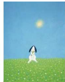
絵本作家・葉祥明の世界展