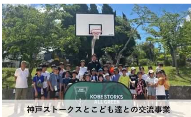
神戸ストークスと子ども達との交流事業