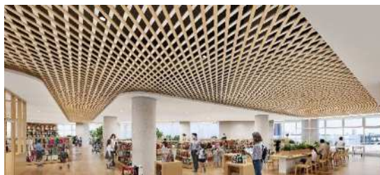
新北図書館整備イメージ