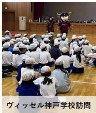
ヴィッセル神戸学校訪問

また、夏休み期間に地域の体育館等を無料開放することにより、子ども達が運動できる環境を提供する。