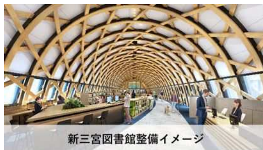
新三宮図書館整備イメージ