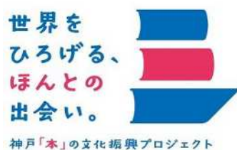
神戸「本」の文化振興ロゴマーク

出版社・書店等との連携により、読書推進イベントの実施やSNSによる情報発信を行うなど、「本」と人の出会いの場を作ることで、「本」を読む人、「本」を買う人を増やし、神戸の「本」文化を振興していく。