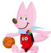
バスケット ボール