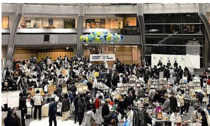
KOBE BOOK FAIR & MARKET 2026