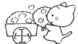
[ 設 備 ]