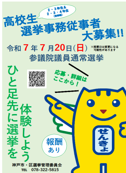
高校生選挙事務従事者募集ポスター