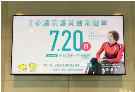
市役所1号館デジタルサイネージ