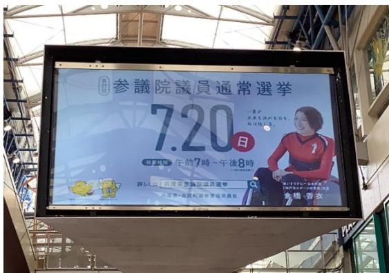
センター街BOSSビジョン