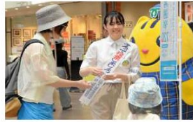
参院選への投票を呼びかける学生(中央) =2025年7月19日午前11時13分、神戸市中央区