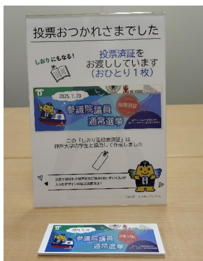
しおり型投票済証