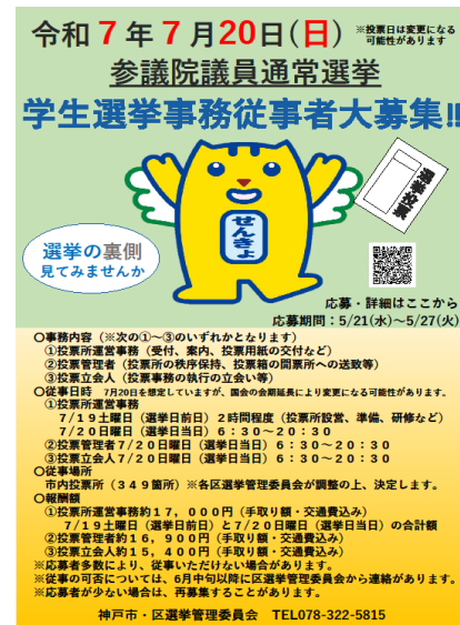
大学生選挙事務従事者募集チラシ