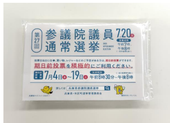
ポケットティッシュ