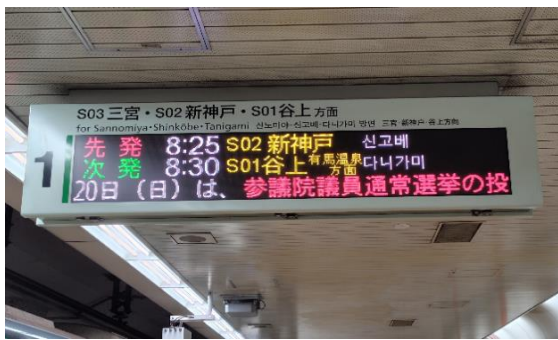
地下鉄駅電光掲示板