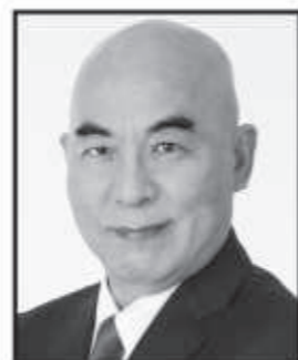
百田 尚樹 ひゃくたなおき 日本保守党 代表 ベストセラー小説『永遠の0』作者