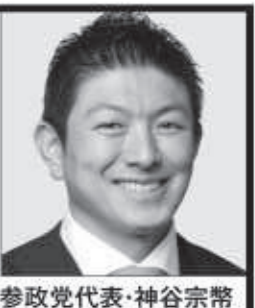
参政党代表・神谷宗幣