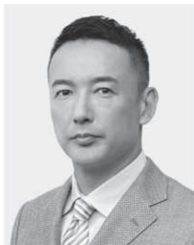
参議院議員 山本 太郎 (れいわ新選組 代表)