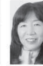
木村英子 (参議院議員)