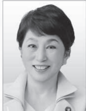
社民党党首 福島みずほ