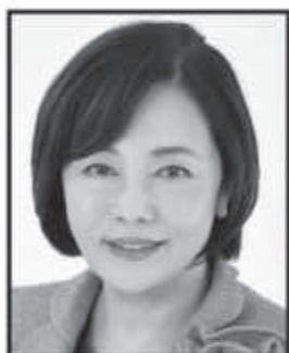
有本 香 ありもとかおり 日本保守党 事務総長 ジャーナリスト