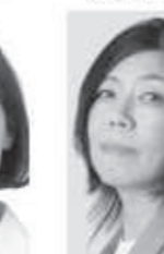
ミサオレツウ (自営業)