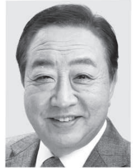
立憲民主党 代表 野田佳彦