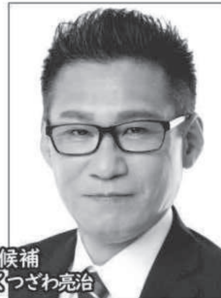
全国比例候補 党代表 かつざわ亮治

昨年、日本人は89万人減少し、在日外国人は33万人増加しました。この異常事態は政府与党が長年「日本人のための政治」を行なってこなかった悪しき結果です。このままでは日本人の日本ではなくなってしまいます。