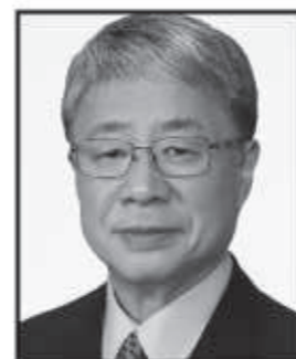
梅原 かつひこ うめはらかつひこ 日本保守党 特別顧問 元仙台市長