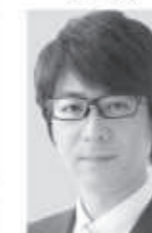
にとうべどうま (自営業)