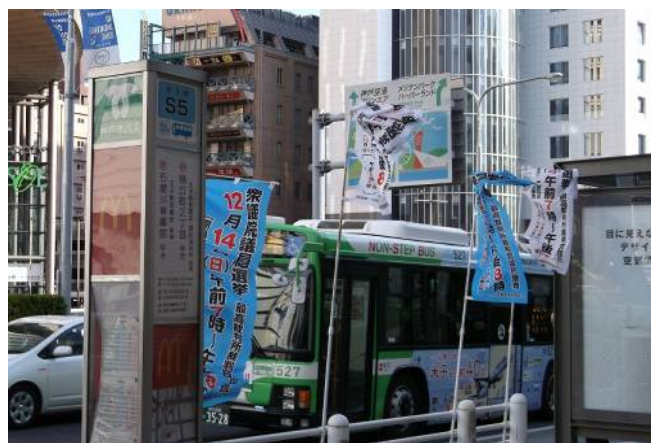
○市バス停留所のぼり