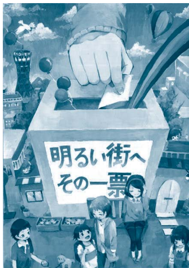
平成26年度 明るい選挙をすすめるポスターコンクール [特選] 神戸市立 住吉中学校3年 渡邊真湖さんの作品