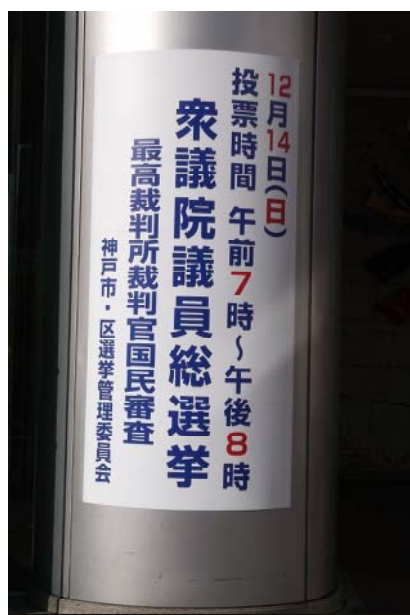
○交通センタービル看板