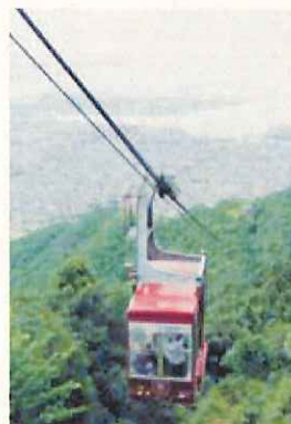
摩耶ロープウェー

区内の南北の連絡動線については、南北バス路線の新設などに取り組んできましたが、今後も引き続き、地域に密着したきめ細かなバス路線網の整備・充実に努めます。また、他地区の状況も調査し、コミュニティバスの運行などの可能性を検討します。