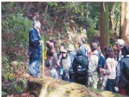
摩耶古道ウォーク