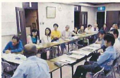
旧西国浜街道の整備を検討するワークショップ

歴史的に重要な道であるとともに、臨海部地域の主要な東西道路である「旧西国浜街道」を、安全・安心・快適な道として整備するなど、地域の魅力づくりを進めます。