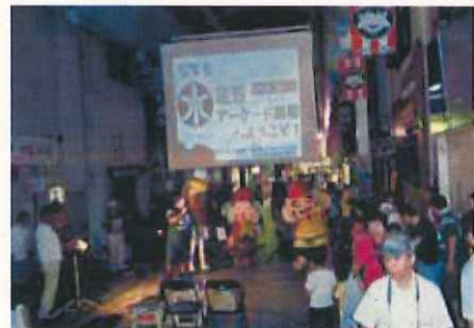
アメリカンフットボール連盟と水道筋商店街の連携による「水道筋アーケード劇場」

子どもたちを対象とした「水道筋アーケード劇場」やエコタウンの推進を目的とした「まちづくりマーケット」など、住民や商業者などの地域団体が開催している地域活性化を目的とするイベントに対して支援を行います。