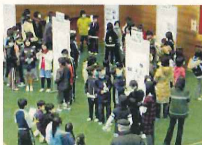
都賀川子どもフォーラム