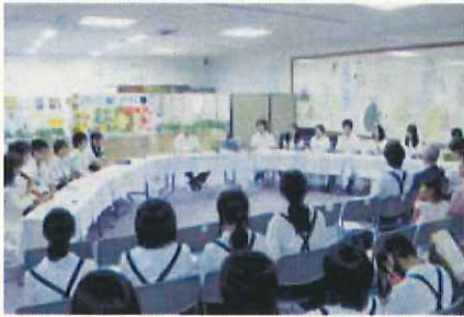
ユースステーション瀬

また、青少年が主体的に活動・発表を行い、異なる世代とも自由に交流できる地域のスポーツ・文化行事等を支援します。