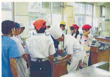
「うえのプロジェクト」によるキャリア教育サポート

青少年の地域とのつながりを一層強化し、地域社会で青少年の健全育成に取り組んでいけるよう、地域団体の活動情報や地域イベントの発信、「都賀川子どもフォーラム」などの学習発表の機会の創出など、子ども会や大学等も含めた仕組みづくりを支援します。