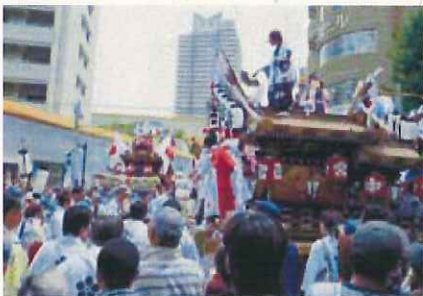
瀬のだんじり祭り

伝統行事への参加を通じて、青少年が地域への愛着や地域とのつながりを感じられる機会を支援し、また、「地域全体での青少年の育成」を行います。