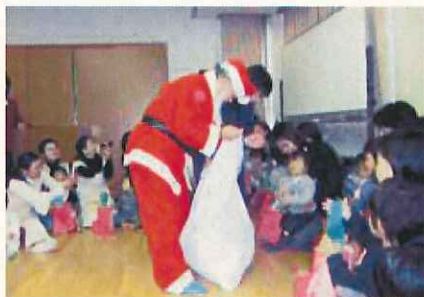
地域福祉センター等を利用した ふれあいのまちづくり協議会と児童との交流事業

地域福祉センターや児童館を利用して高齢者と乳幼児・学童との地域での世代間交流を図ります。また、区内の学校と連携した子育て体験学習等を通して、次世代の親育ちを支援します。