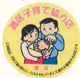
子育て協力店の認定ステッカー

乳幼児をもつ保護者が気軽に安心して利用できる「子ども連れ歓迎」の店を「子育て協力店」として認定し、子育てしやすい環境づくりを進めます。