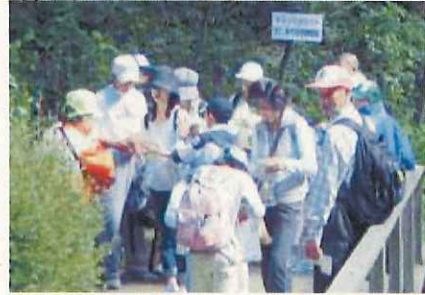
家族での参加イベント「摩耶山ファミリーアドベンチャー」

青少年育成協議会やふれあいのまちづくり協議会などの地域団体と連携し、家族のきずなについて考え、また、家族が一緒に出かけ、ふれあえる機会を創出します。