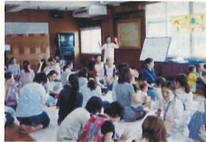
ベビーキャラバン

地域に出向いて子育てボランティアと親子を結ぶ場(ベビーキャラバン)を提供し、地域での子育て仲間づくりの支援・育児相談を行い、地域住民の参加を得た子育てを促進します。