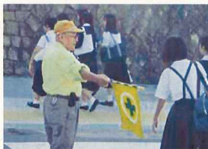
登下校時の「見守り活動」

学校における安全教育を徹底するとともに、学校・家庭・地域・行政が連携して、地域における「こども見守り活動」などの声かけ・あいさつ運動を推進し、さらに「なだ・防犯ナビ」等を活用した安全情報（不審者や犯罪発生情報など）の共有化を進めます。