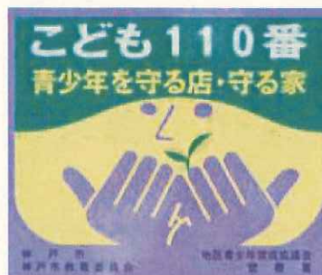
「こども110番 青少年を守る店・家」のロゴマーク

今後もあいさつ運動や地域内の巡回活動「愛のひと声運動」、「こども110番 青少年を守る店・守る家との協力」など、地域全体で青少年の健全育成を見守ります。