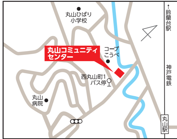
丸山コミュニティセンター 【長田区西丸山町1-7-5】