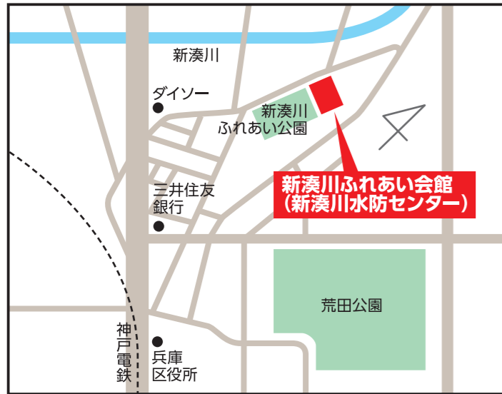
新湊川ふれあい会館(新湊川水防センター) 【兵庫区東山町1-9-20】