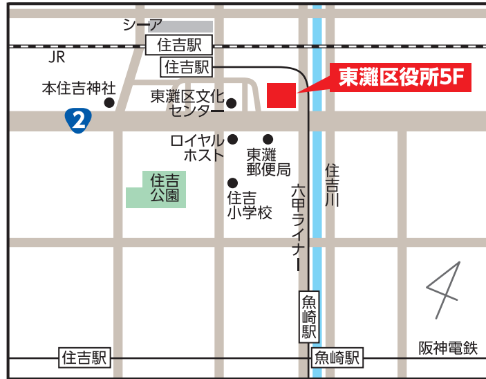
東灘区役所5階 【東灘区住吉東町5-2-1】