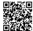
住民票申請表 (日文・英文)