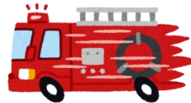
Trak ng bombero