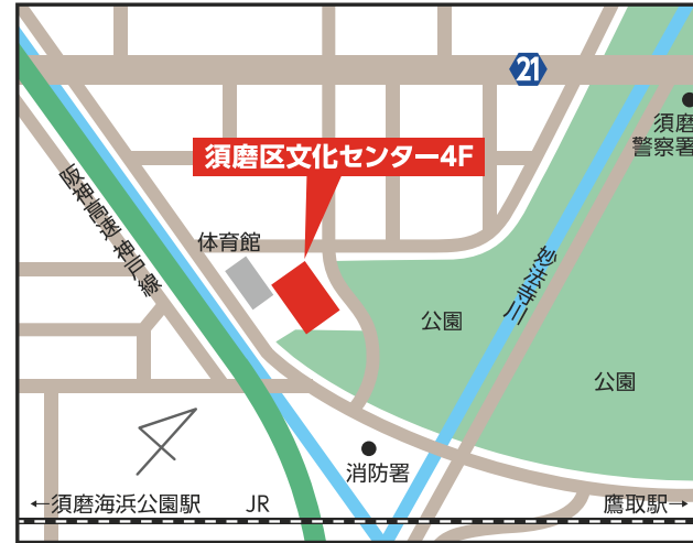
須磨区文化センター4階 【須磨区中島町1-2-3】