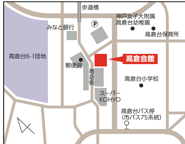
高倉会館 【須磨区高倉台4-2】