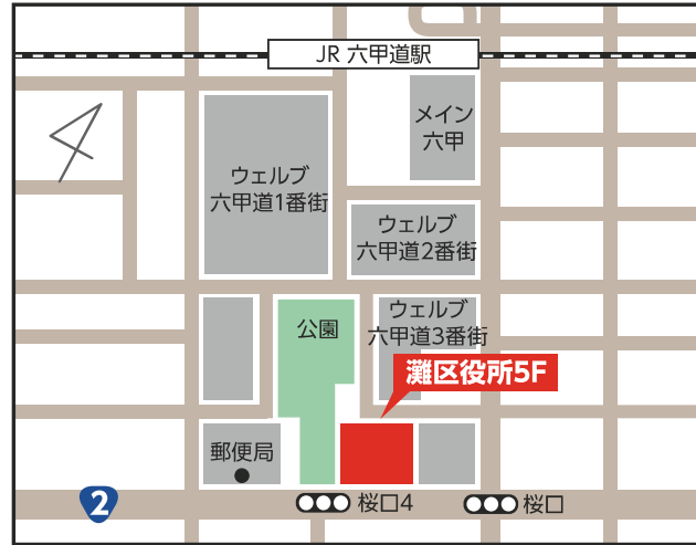
灘区役所5階 【灘区桜口町4-2-1】