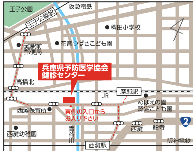
兵庫県予防医学協会 健診センター 【灘区岩屋北町1-8-1 (JR摩耶駅徒歩5分)】