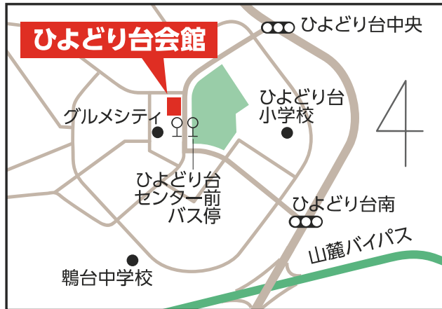
ひよどり台会館 【北区ひよどり台2-1-1】