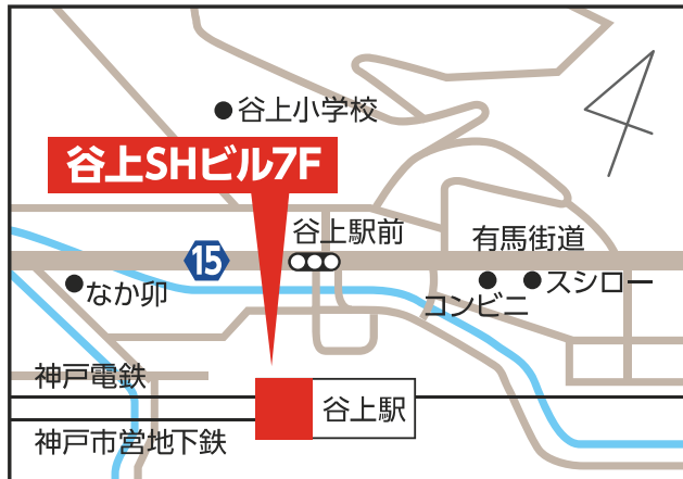
谷上SHビル7階 【北区谷上東町1-1】