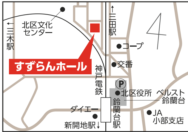
すずらんホール 【北区鈴蘭台西町1-26-1】