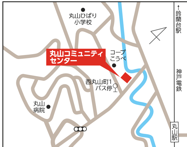
丸山コミュニティセンター 【長田区西丸山町1-7-5】